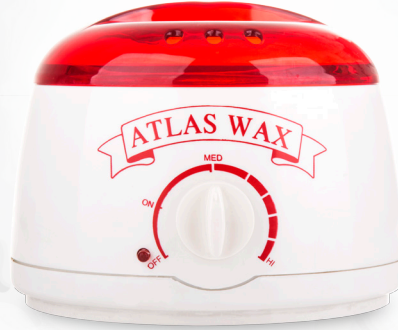
دستگاه موم داغ کن (ProWax)