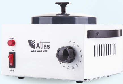
دستگاه موم داغ کن تک قابلمه