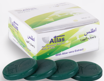
عصاره آلوئه ورا