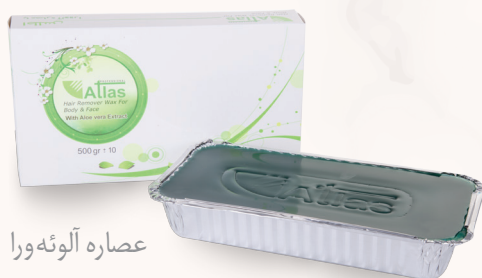
عصاره آلوئه ورا