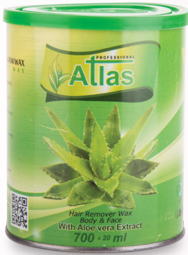
عصاره آلوئه ورا