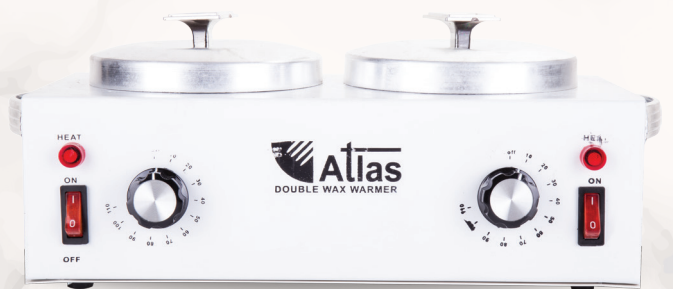
دستگاه موم داغ کن دو قابلمه